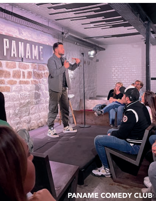
PANAME COMEDY CLUB