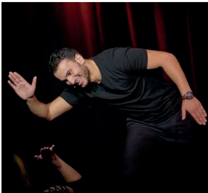
Ce qui lui tient le plus à cœur ? « Représenter le Valenciennois et rendre fiers ses habitants ». »

« Je me produis tous les jours, sauf le lundi, au Paradise République, à 13 h 30. Après mes représentations on retravaille avec mon équipe sur ce qui n'a pas été, comme les mots parasites. Le but c'est d'avoir un spectacle le plus carré possible. C'est trois à quatre heures d'écriture, réécriture et apprentissage par jour. »