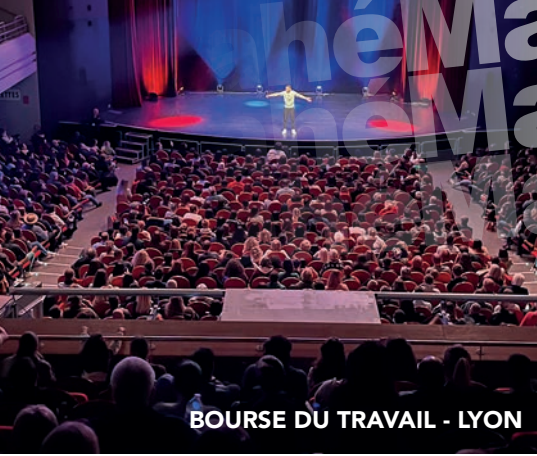
BOURSE DU TRAVAIL - LYON