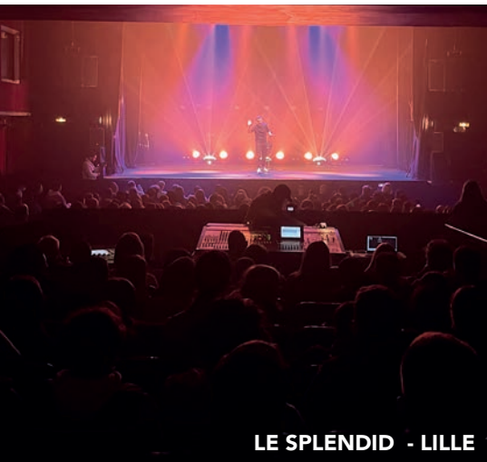
LE SPLENDID - LILLE